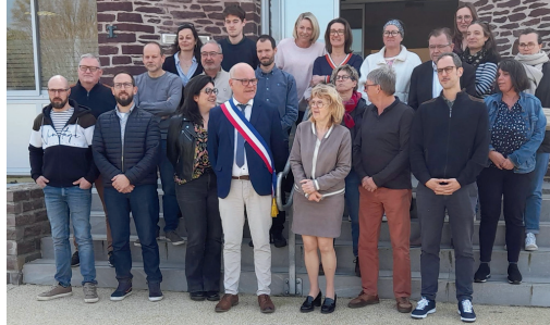
La nouvelle équipe - absent sur la photo Chris TEXIER

Monsieur le Maire a également procédé à la nomination de deux conseillers délégués :