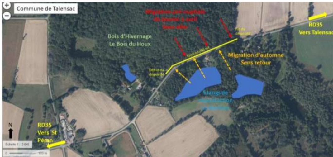
Carte de localisation et schéma des zones à enjeu du dispositif barrière piège de la D35 reliant Talensac à Saint Péran (vues IGN et aérienne)