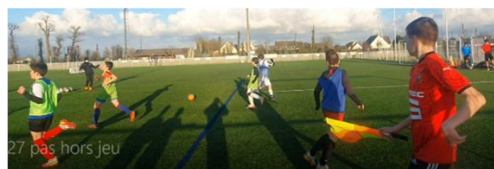
Sensibilisation à l'arbitrage au FC Breteil Talensac

Dans le cadre du PEF (programme éducatif fédéral), le club mène des actions citoyennes à destination de ses jeunes licenciés sur différents thèmes : fair-play, environnement, respect, arbitrage.